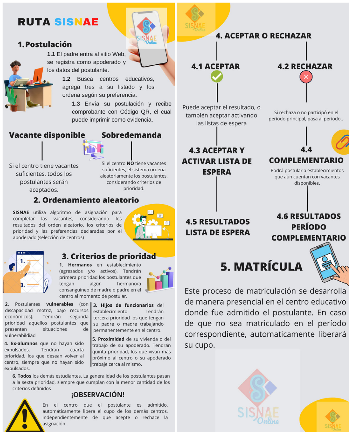
Figura2 - Secuencia lógica del sistema